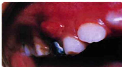
Parulis; non-vital primary first molar. آبسه دندانی

• دندان درد علل مختلفی دارد که شایعترین آنها پوسیدگی دندان می باشد، اگر پوسیدگی به موقع برداشته و دندان ترمیم نشود، میکروبها و یا سموم آنها به مغز دندان و سپس ریشه دندان و بافت نگهدارنده اطراف دندان می رسند و در نهایت منجر به ایجاد آبسه می گردند .